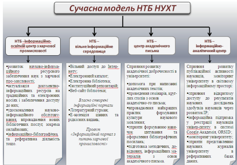
Іл. 1. Сучасна модель НТБ НУХТ