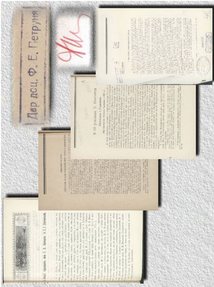
Ил. 4. Страницы оттисков статей из фонда Ф. Е. Петруня. Автограф и дарственный штамп владельца.