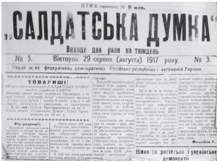
Ил. 3. Газета «Солдатська думка».