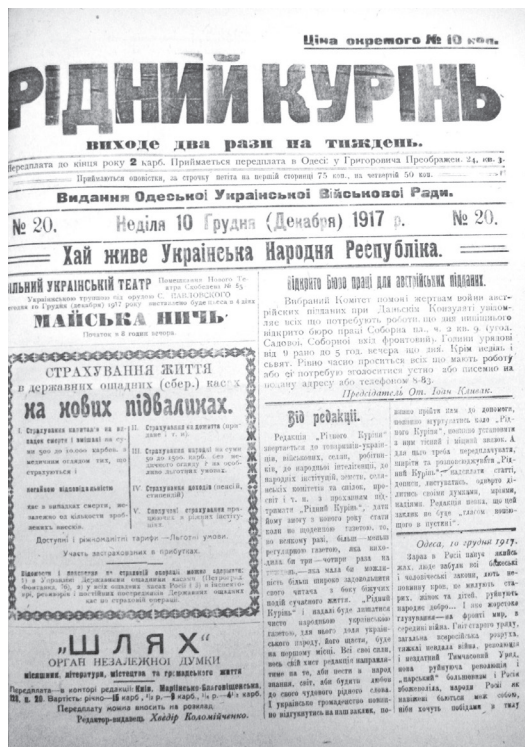
Ил. 4. Газета «Рідний курінь».