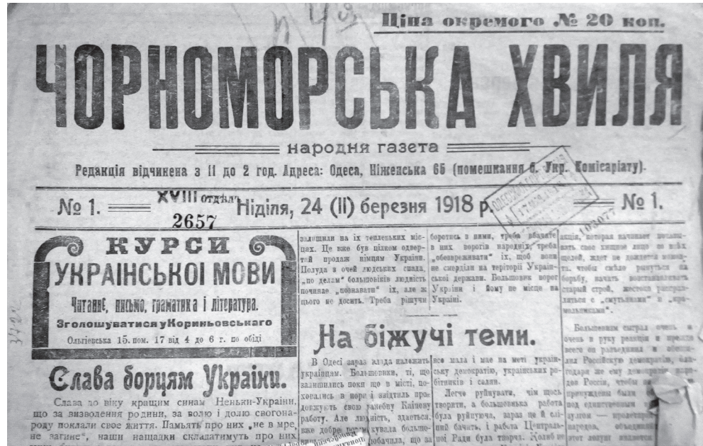
Ил. 5. Газета «Чорноморська хвиля».