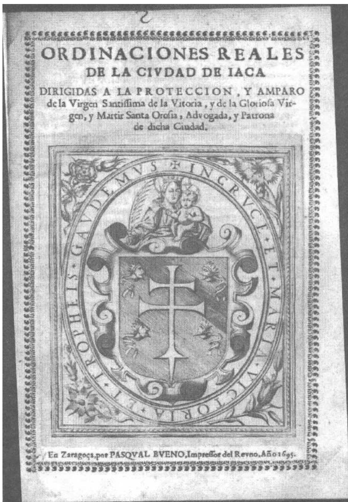
4. Королевские ордонансы города Хака... — Сарагоса, 1695.