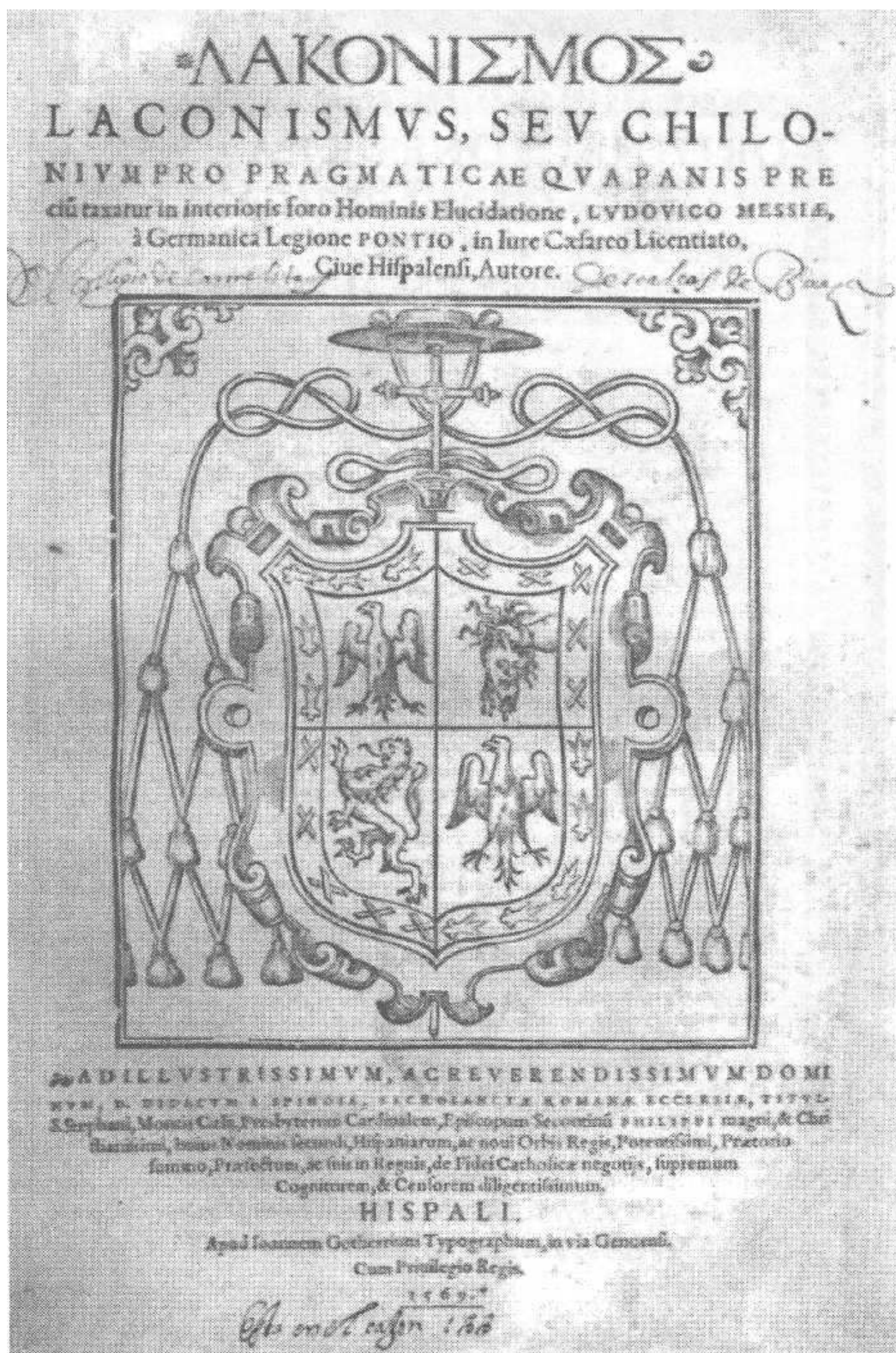
5. Понс де Леон, Людовик. Лаконисмус, или Хилона про прагматику, которой стоимость хлеба определяется на внутреннем рынке... — [Севилья], 1569.