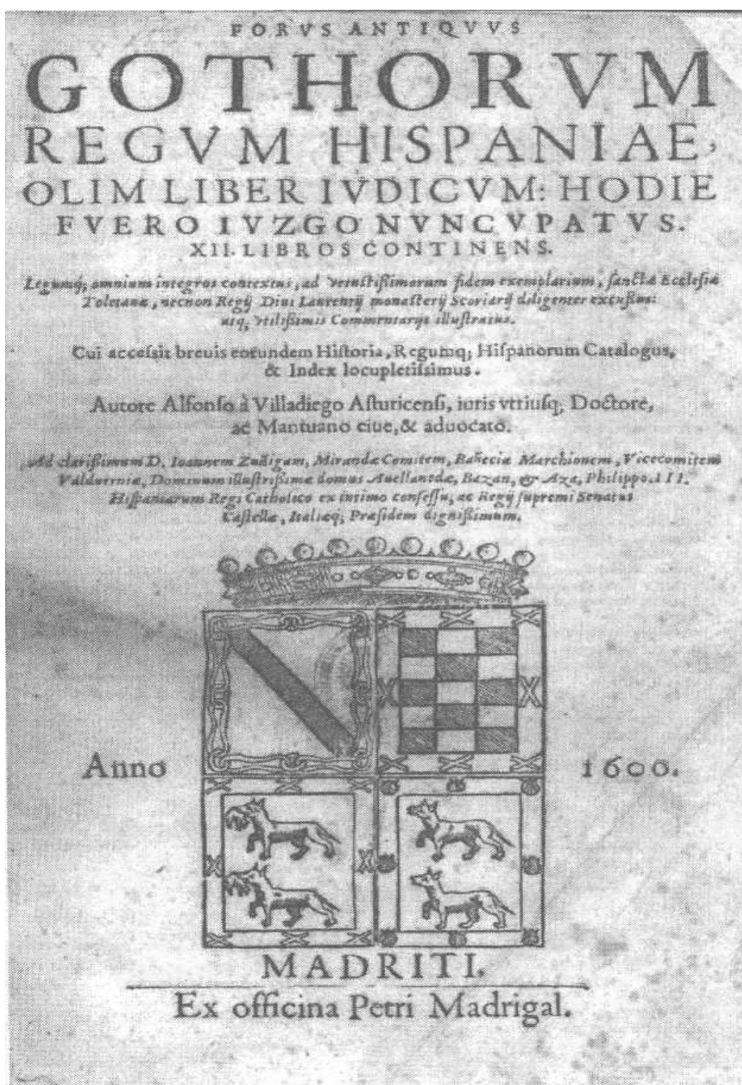
6. Вилладиего, Альфонсо. Древнее фуэро готских королей Испании, некогда книга Судей: сегодня Фуэро Хузго называемое... — [Мадрид], 1600.