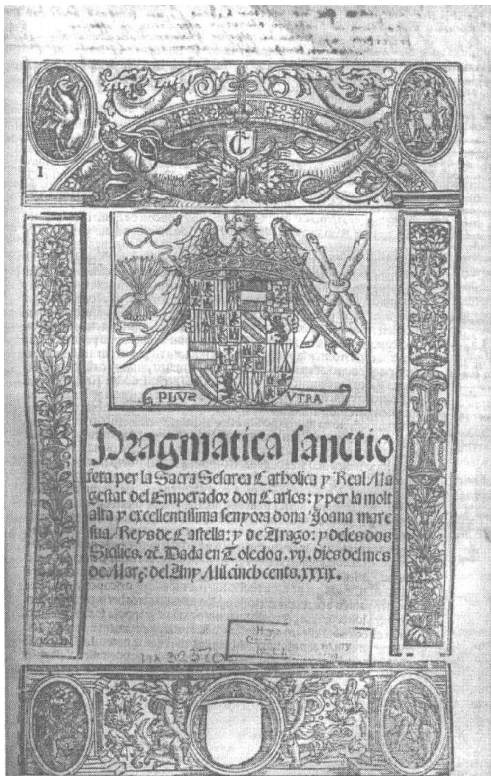
1. Прагматическая санкция, данная доном Карлосом... и донной Иоанной, матерью его, королями Кастилии и Арагона и обеих Сицилий... в Толедо... — [Барселона, 1539].