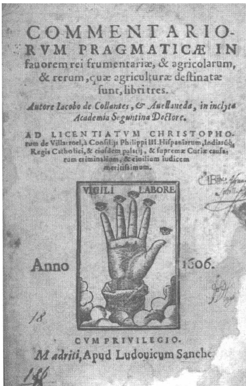
7. Коллантес-и-Авелланеда, Яков. Комментариев прагматики в благоприятствовании речному судоходству и агрокультуре, и вещей, что агрокультуру укрепляют, три книги. — [Мадрид], 1606.