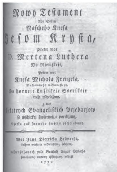
Ил. 4. Новый Завет..., переведенный д. Мартином Лютером на немецкий язык, а затем на верхнелужицкий Михаилом Френцелем (Бауцен, 1797)