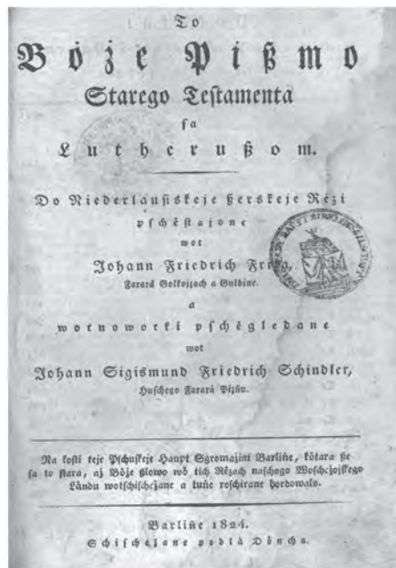
Ил. 5. Святое писание Старого Завета за Лютером... на нижнелужицкий язык переведенное Й. Шиндлером (Берлин, 1824)