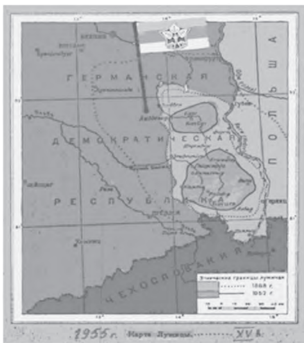
Ил. 1. Карта расселения лужицких сербов в 1886 и 1952 гг.

Подводя итоги проведенного исследования, подчеркнем, что Анджей Кухарский был не первым путешественником по славянским землям, однако, результаты его поездок имеют огромное значение для изучения славянской культуры. Книжное собрание А. Кухарского богато библиографическими редкостями и представляет собой огромный интерес как историко-культурный памятник прошлых столетий. Коллекция представлена изданиями, разнообразными по тематике, языковой принадлежности, в которых отражено развитие славянской истории более чем трех столетий. Данный книжный комплекс включает ценные материалы, которые могут стать основой для изучения богатого культурного наследия лужицких сербов.