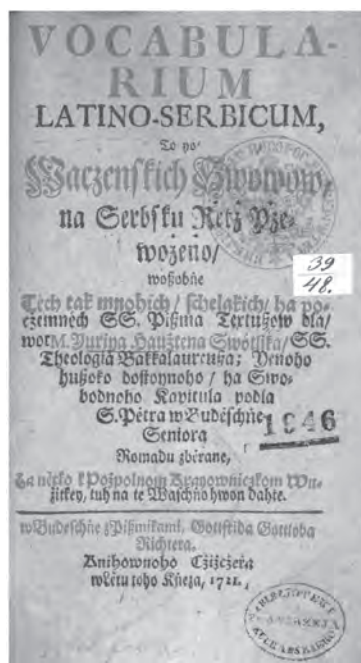
Ил. 8. Словарь латино-сербский... Ю. Светлика (Бауцен, 1721)