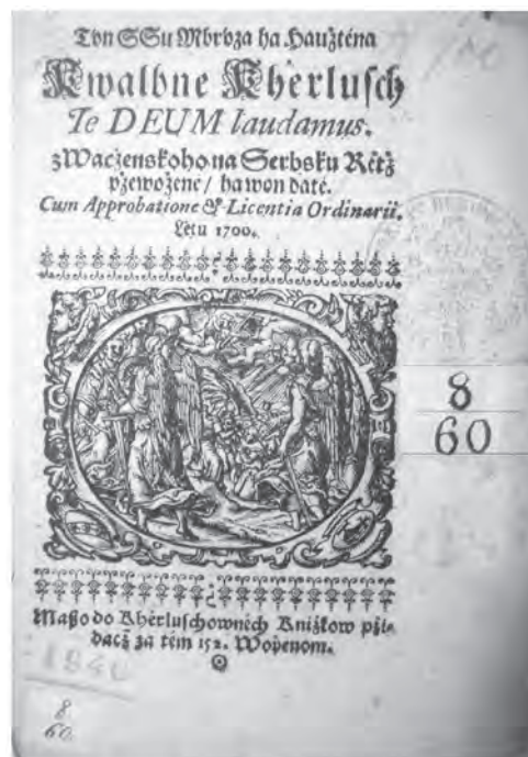
Ил. 7. Текст песнопений «Тебя, Бога, хвалим» ([1700])