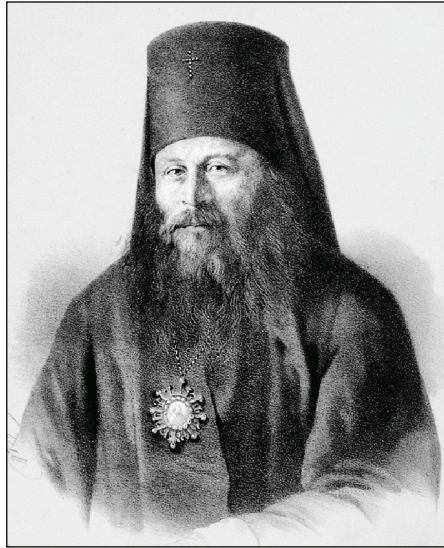
Ил. 2. Иннокентий (Борисов И. А.)

(ил. 2) в 1853 г. составил примерную программу епархиального издания, которая вследствие Крымской войны осталась без рассмотрения. Уже после смерти владыки, его преемник архиепископ Херсонский и Одесский Димитрий (Муретов К. И.) (ил. 3) в 1859 г. представил эту программу на рассмотрение Святейшего Правительственного Синода.