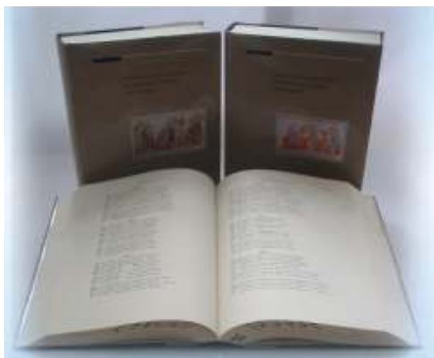
Іл. 4. «Повість временних літ: міжрядкове співставлення і парадосис», видане Українським науковим інститутом Гарвардського університету.