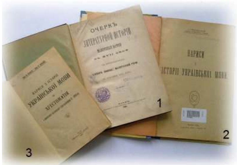
Іл. 13. Студії з історії української мови: 1) «Очерк литературной истории малорусского наречия в XVII веке с приложением словаря книжной малорусской речи по рукописи XVII века» П. Житецького; 2) «Нариси з історії української мови» І. Свенціцького; 3) «Нариси з історії української мови та Хрестоматія з пам'ятників письменської старо-українщини XI-XVIII вв.» О. Шахматова та А. Кримського.