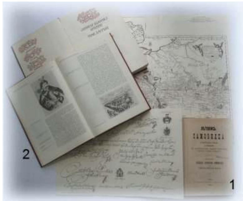
Іл. 9. Козацькі літописи у фондах НБ: 1) «Літопис Самовидця», виданий Київською Археографічною комісією; 2) Перший науковий переклад «Літопису Самійла Величка» українською мовою.