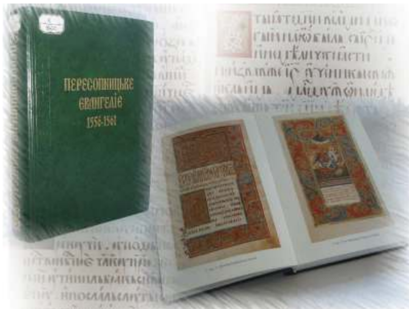
Іл. 7. Перше повне факсимільне видання Пересопницького Євангелія.