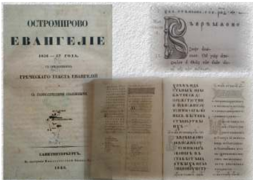
Іл. 1. Перше наукове видання Остромирового Євангелія, здійснене О. Х. Востоковим.