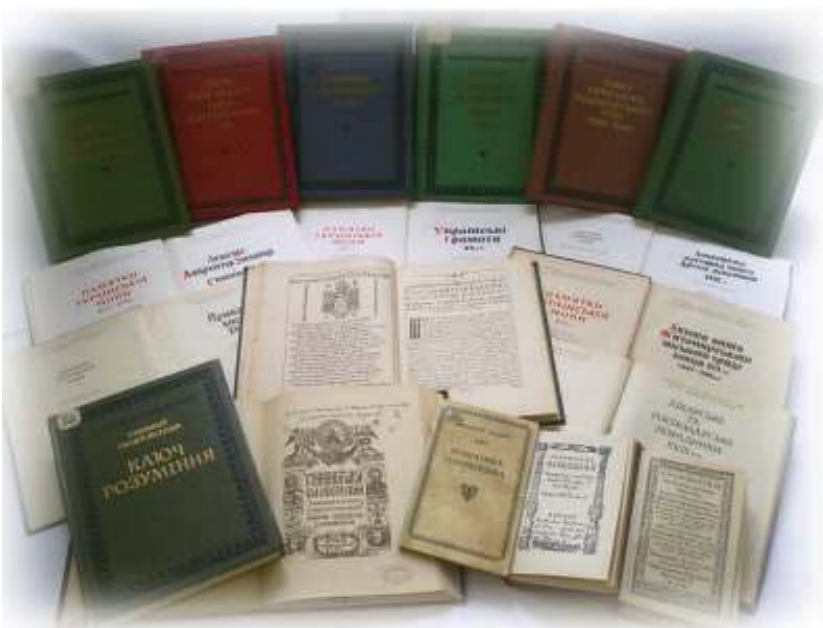
Іл. 15. Серія «Пам'ятки української мови» у фондах Наукової бібліотеки.