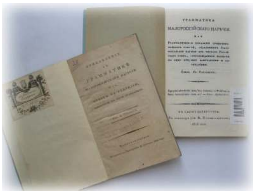
Іл. 12. Факсимільне видання «Граматики малоросійського наречія...» та «Прибавление к Грамматике...» О. Павловського.