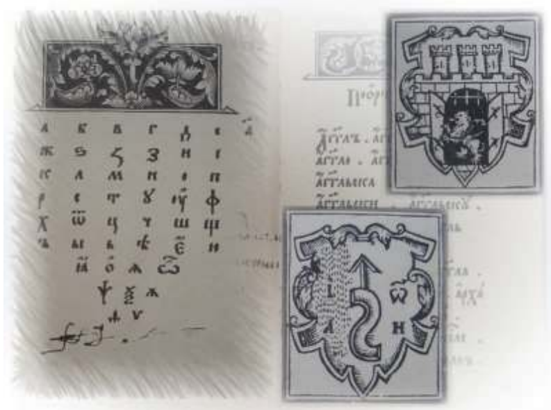
Іл. 10. Фотомеханічне видання «Букваря» І. Федорова: кириличний алфавіт та зображення герба м. Львова з друкарським знаком І. Федорова.