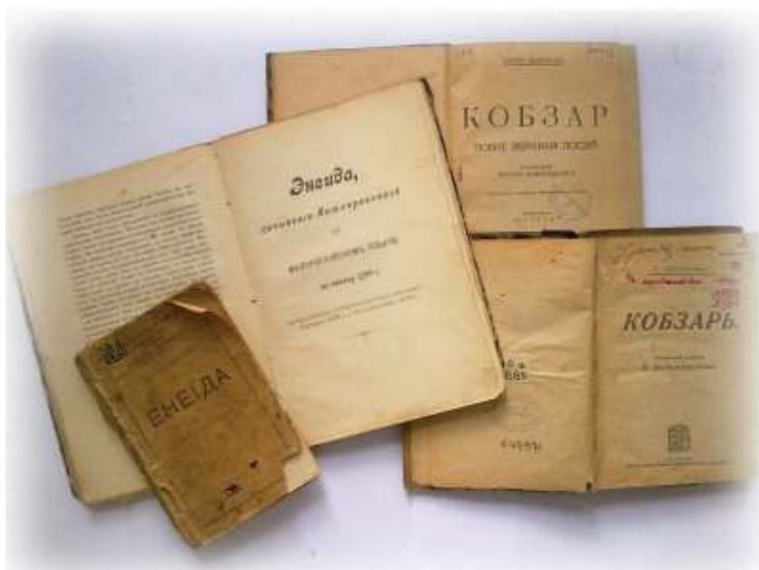
Іл. 11. Видання «Енеїди» І. Котляревського, здійснене П. Житецьким, та «Кобзаря» Т. Шевченка, під редакцією В. Доманицького.