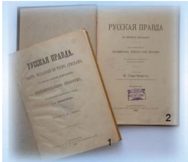
Лл. 5. «Руська Правда» у фондах Наукової бібліотеки: видання А. Гінцбурга та В. Сергєєвича.