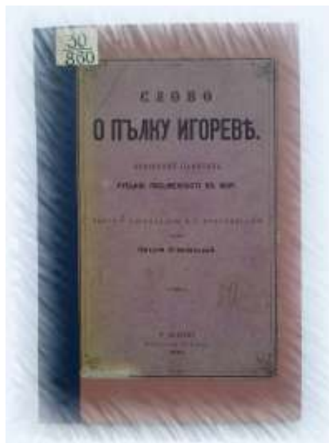
Лл. 6. Один із перших перекладів «Слова о полку Ігоревім» українською мовою, виданий О. Огоновським.