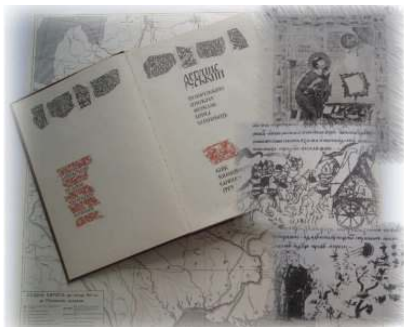
Іл. 8. Перший документальний науково-академічний переклад «Літопису руського» українською мовою.