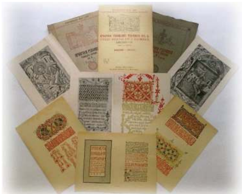
Іл. 14. «Прикраси галицьких рукописів XVI в.» І. Свенціцького.