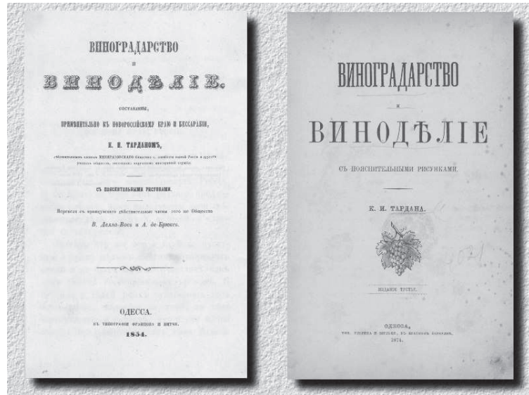
Іл. 1. Титульні сторінки книги К. І. Тардана «Виноградарство и виноделие» (перше видання – 1854 р., третє видання – 1874 р.)