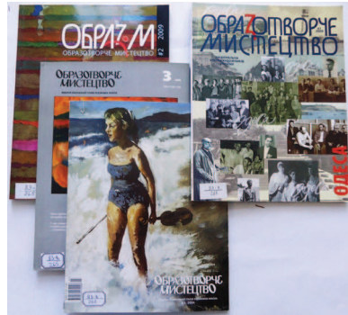
Лл. 6. Періодичні літературно-художні видання

ні мистецтвознавчі журнали, як «Образотворче мистецтво», «Галерея» та «Музейний провулок» (іл. 6). Керуючись методом суцільної вибірки, нами були переглянуті усі випуски цих журналів, представлені у фондах Наукової бібліотеки, на основі чого було доповнено бібліографічний список і статтями по окремим персоналіям митців. Отже, подаємо короткий огляд видань.