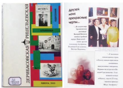
Іл. 7. Сторінками видання «Дерибасовская-Ришельевская»