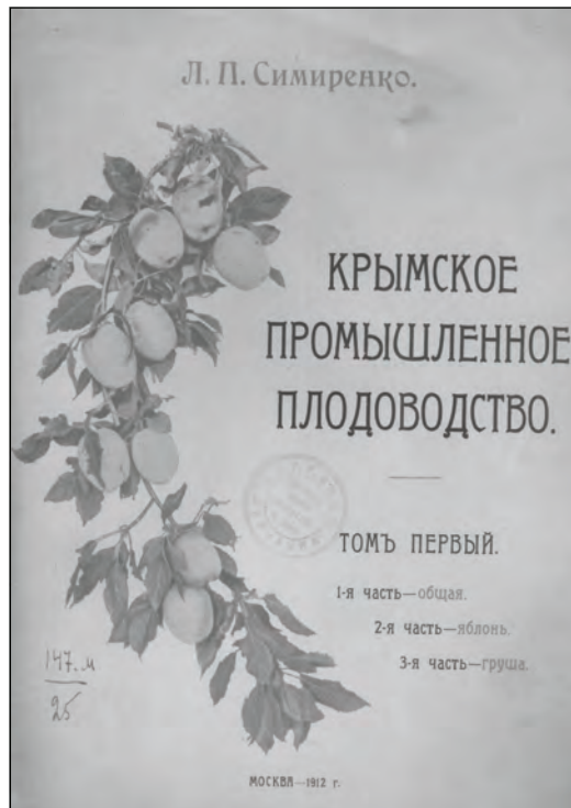
Іл. 6. Обкладинка найвідомішої праці Л. П. Сими́ренка «Крымское промышленное плодоводство»