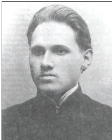
Володимир Смирєнко (1891—1938), студент

Велику справу свого батька продовжив син вченого Володимир Смирєнко (1892—1938) (іл. 10). Як і батько, ще змалку Володимир захоплювався садівництвом. Вже через рік після загибелі Лева Платоновича Володимира призначають директором першої в Україні науково-дослідної садівничої станції та Центрального державного плодового розсадника України. У роки громадянської війни грабежі більшовиків та денікінців довели «Левкову станцію» до занепаду. За лічені роки Володимир Львович перетворив зрушений, здичавілий розсадник і колекційний сад у повноцінну садівничу станцію, найкращу в СРСР, одну з найавторитетніших у світі. Доцент, професор садівництва Володимир Смирєнко завідував кафедрою плодово-ягідного господарства Київського політехнічного інституту, викладав у Полтавському та Уманському сільськогосподарських інститутах (іл. 11). У 1923 р. створив Всеукраїнську помологічну комісію, яка згодом стала державною. Впродовж 1920—30-х рр. під редакцією Володимира видаються перші українські журнали з практичного садівництва та городництва.