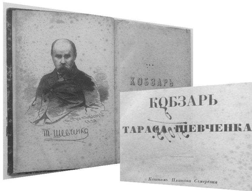
Іл. 2. Останнє прижиттєве видання "Кобзаря" Т. Г. Шевченка (1860), надруковане коштом Платона Смиренка

Крім інтересу до промисловості, представники родини Смиренко цікавилися культурою та освітою. З ініціативи П. Смиренка у Мліві були відкриті приходське училище, недільна школа для дорослих, технічне училище. Вже давно відомий той факт, що саме на кошти Платона Смиренка було надруковано останнє прижиттєве видання «Кобзаря» Т. Шевченка (іл. 2). Один з примірників того «Кобзаря» зберігається в Науковій бібліотеці ОНУ імені І. І. Мечникова.