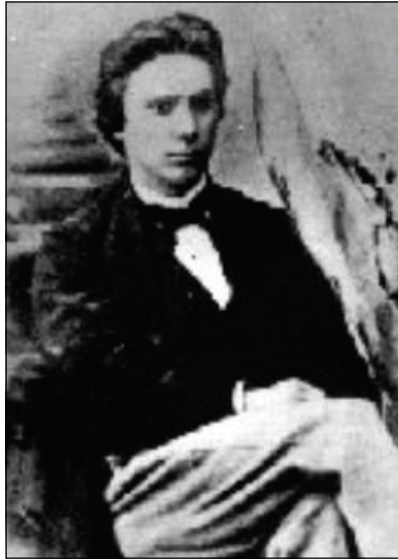
Іл. 3. Васи́ль Федорович Сими́ренко

В. Сими́ренка вийшло кілька видань «Кобзаря», а також відомі праці професора О. Кістяковського, М. Драгоманова, видатного етнографа П. Чубинського, твори М. Коцюбинського, І. Шраги. Своїми коштами Василь Федорович підтримував громадське зібрання «Родина», Товариство допомоги культурі й нації, Наукове товариство імені Т. Г. Шевченка у Львові (передав М. Грушевському 1000 карб. золотом на закупівлю будинку для товариства). Крім того, В. Сими́ренко фінансував створення хору Н. Лисенка та його закордонну подорож, переклад українською «Іліади» Гомера композитором П. Ніщинським, заснування одного з найкращих любительських театрів у с. Сидорівка, придбання М. Драгомановим типографії у Швейцарії. Наведений перелік благодійних справ Васи́ля Сими́ренка далеко не повний. Він наслідував сімейному принципу не розголошувати своєї благодійності. Врешті-решт, в останні роки свого життя видатний добродійник склав заповіт, за яким усе майно, що оцінювалося в 10 мільйонів карбованців, після смерті його дружини (дітей у Сими́ренків не було), мало піти на потреби української науки і культури. Помер Васи́ль Федорович Сими́ренко на 81-му році життя в Києві. Був похований 1915 року на Аскольдовій могилі.