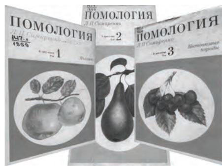
Іл. 8. Фундаментальна праця Л. П. Симиренка «Помология»