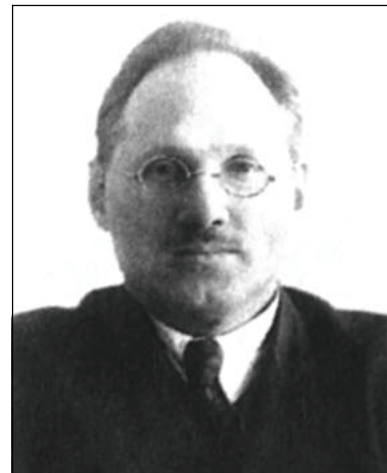
Володимир Львович Смирєнко (1891—1938)

Він писав підручники, які спеціалісти назвали зразковими («Садовий розсадник», «Плодові сортименти України»). Фундаментальною працею вченого стало «Часткове сортознавство плодкових культур», яке було здано до друку в листопаді 1932 р.